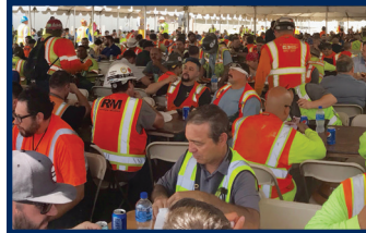
Los trabajadores de la construcción del Estadio Los Ángeles disfrutaron del almuerzo brindado por Dulan's Restaurant.