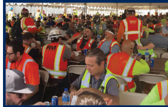
LA Stadium construction workers enjoy lunch catered by Dulan's Restaurant.